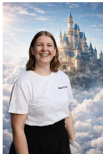
Die Finanzverantwortliche mit einer Visualisierung der budgetierten Luftschlösser.