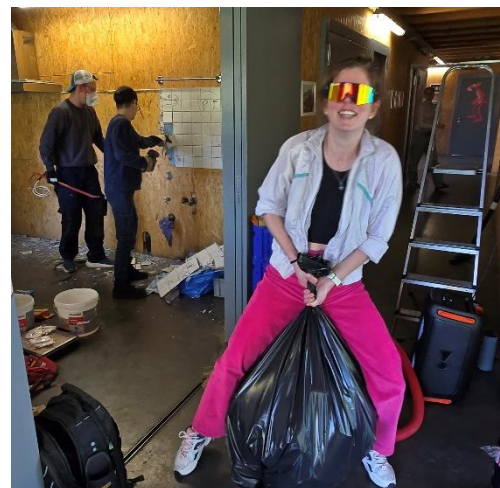
Umbau der Küche

Das war auch immer wieder mal nötig, wenn beispielsweise unsere Gäste des Europäischen YMCA rein mengenmässig unser Haus an seine Grenzen brachten. Gleichzeitig sind wir auch hier über alle Grenzen (besonders Ländergrenzen) hinausgewachsen und sind stolz darauf, dass wir Entfelden für einen Moment zum Mittelpunkt Europas (zumindest was YMCA angeht) gemacht haben. Wir hoffen die Teilnehmenden denken noch lange an uns und haben ihnen als