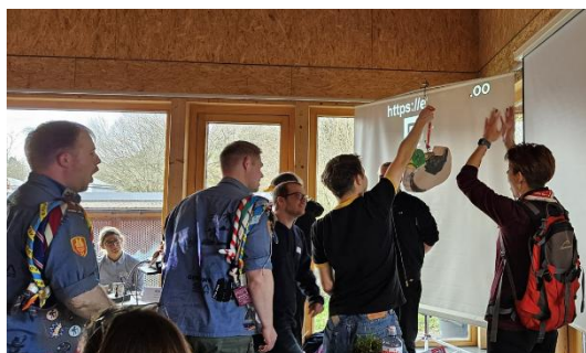
Entenpinata für die Cevi Schweiz

Gedächtnisstützen kleine Entenanhänger überreicht.