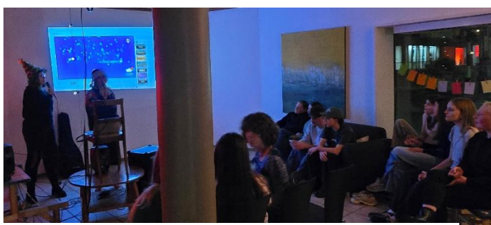
öffentlicher Karaoke-Abend im Tuechschmiedhuus

Ein weiteres kleines Luftschloss (oder wollen wir vielleicht lieber sagen «Lufthaus»?) bei dem wir geholfen haben Grundsteine zu legen, ist das Tuechschmiedhuus. Diese durch die Gemeinde Oberentfelden als kulturelle Zwischennutzung konzipierte Initiative bietet eine willkommene Plattform an, um Jungschichtypische oder auch weniger typische Anlässe für das ganze Dorf zu öffnen. So finden regelmässig durch uns organisierte Spieleabende, Jam-Sessions