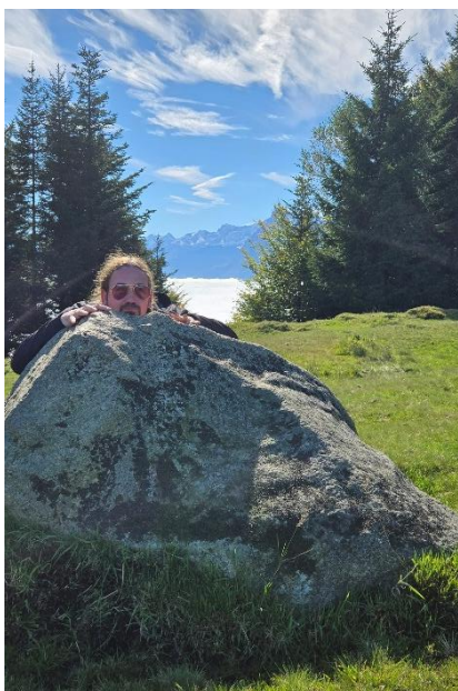
Das Präsidium am Steine für Luftschlösser legen (Hela 25)

(Dieser Bericht legt den Fokus auf die Vorstandsarbeit – für den Jahresbericht der Jungschararbeit liegt der Bericht des ALTs vor)